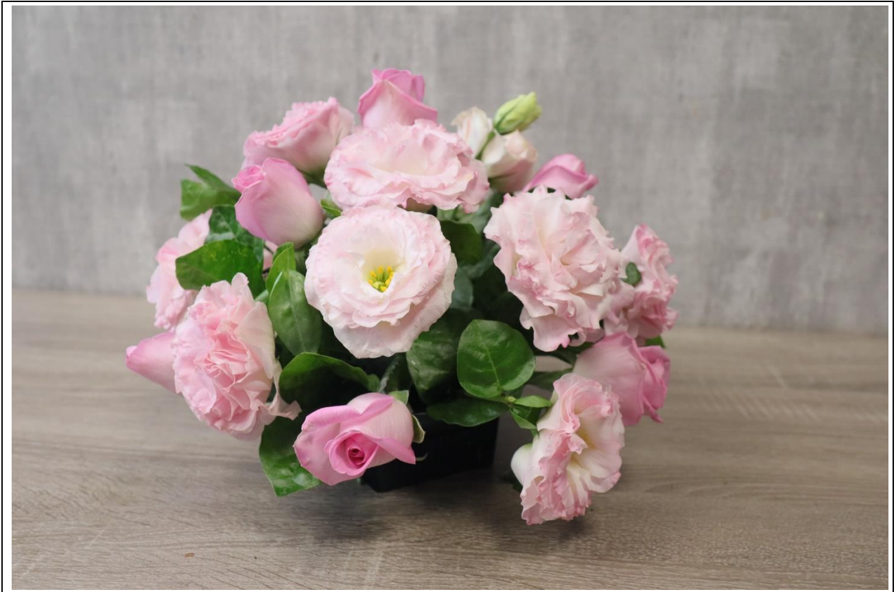
圖 12：參考插作步驟三