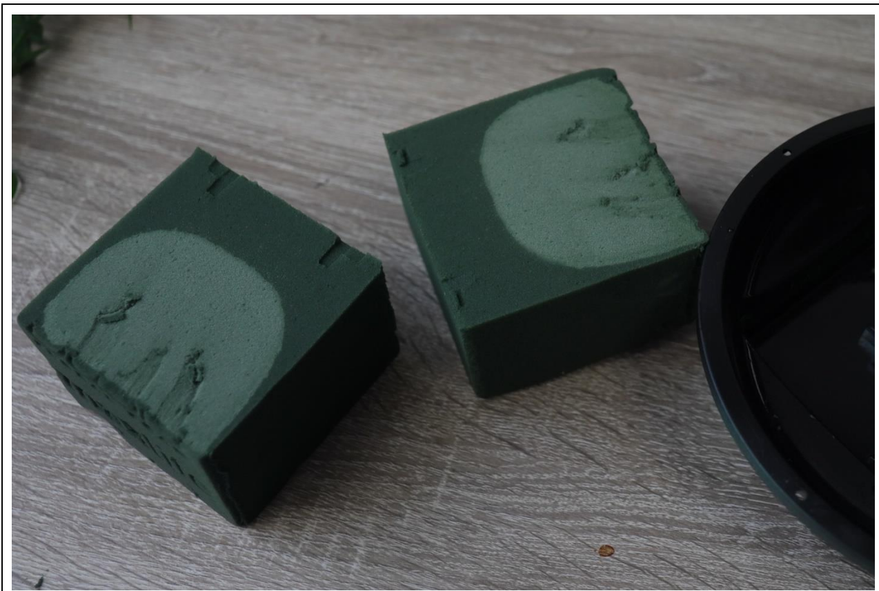
圖 23：扣分範例九，海綿吸水未吸透(切開檢查)