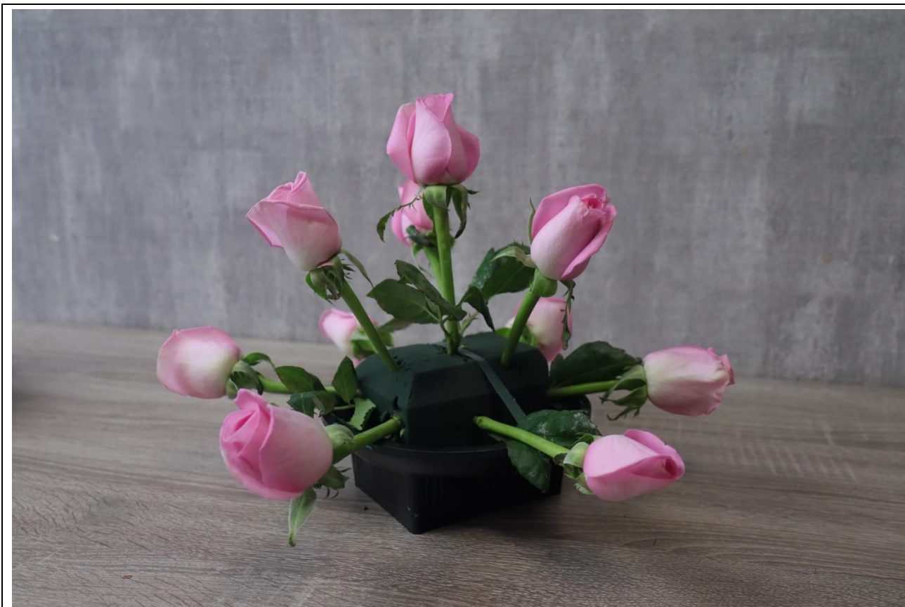
圖 10：參考插作步驟一