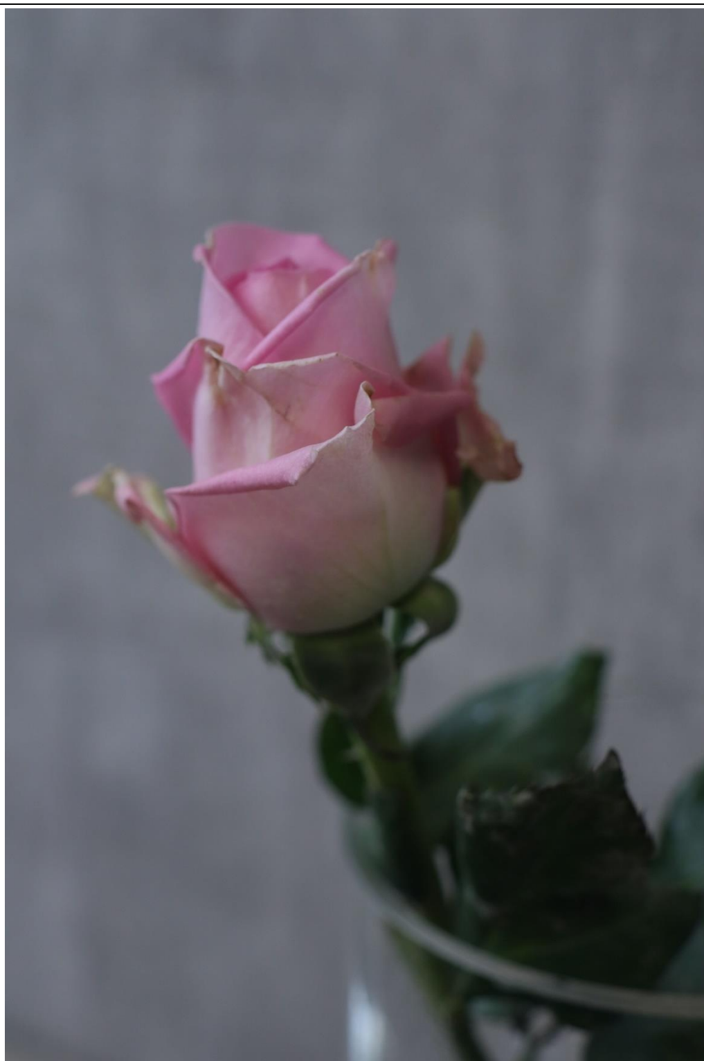
圖 17：扣分範例三，花瓣未整理