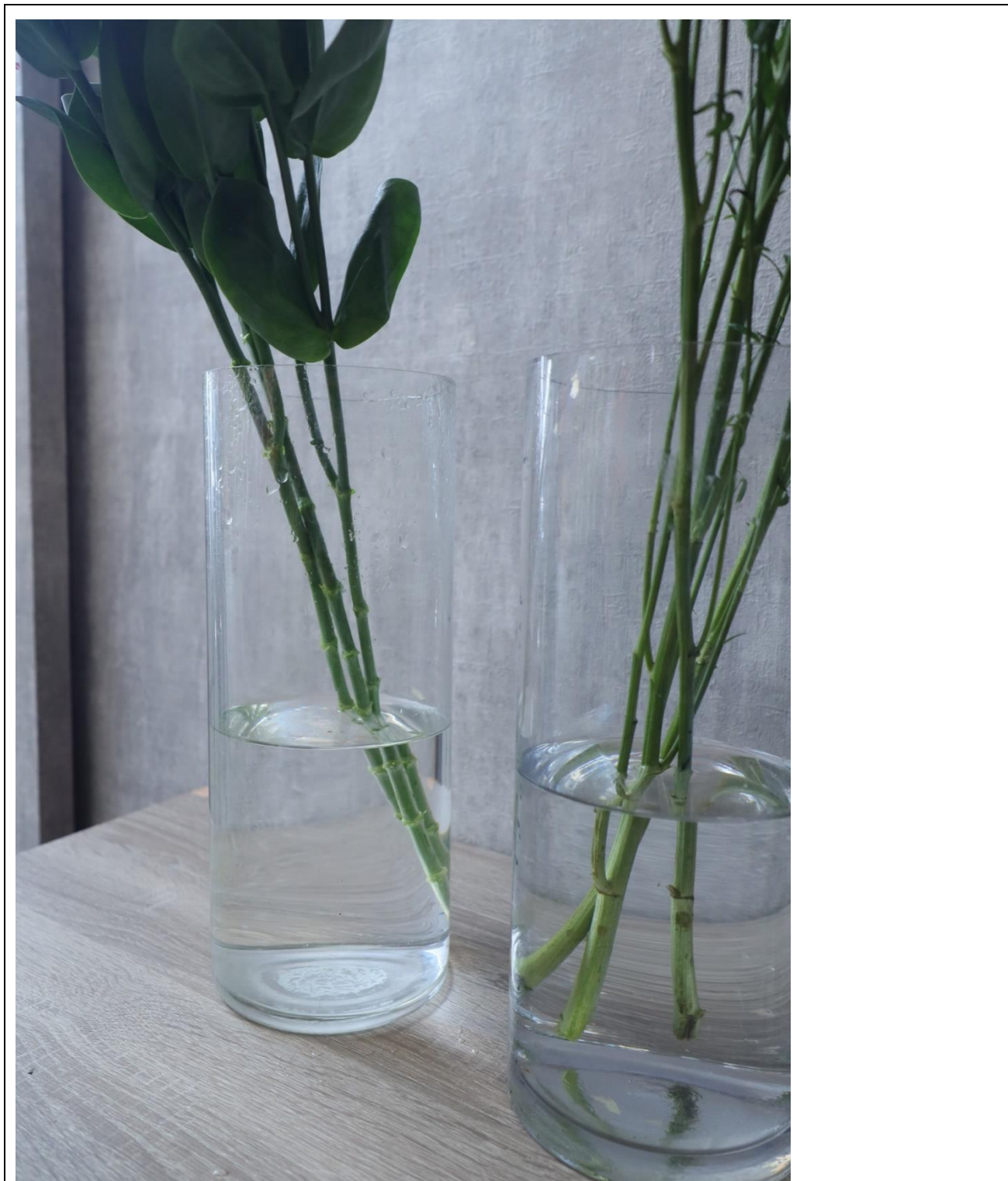
圖 6：洋桔梗整理後細節