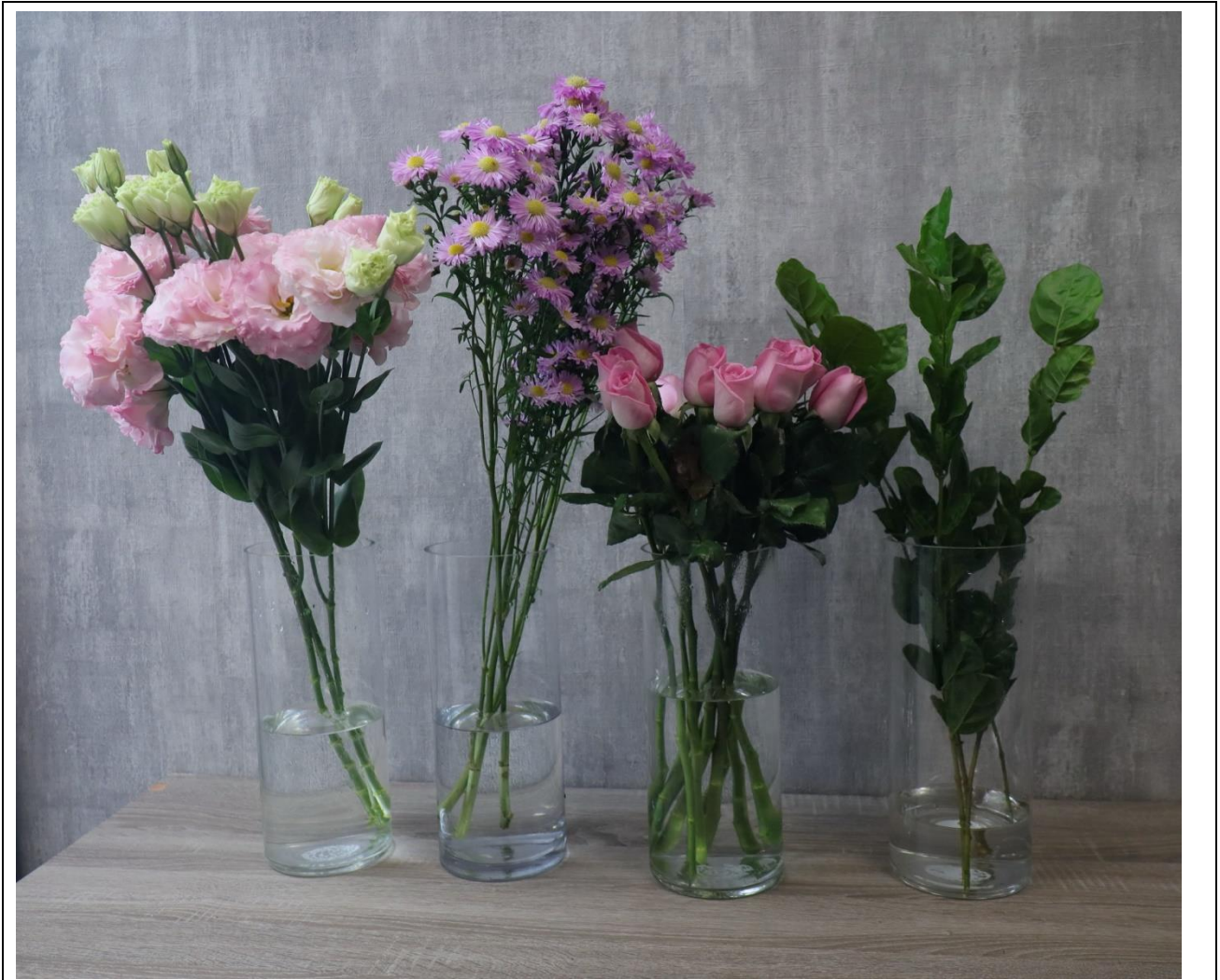
圖 2：花材整理後範例，留意去除葉片比例，與整理後花況