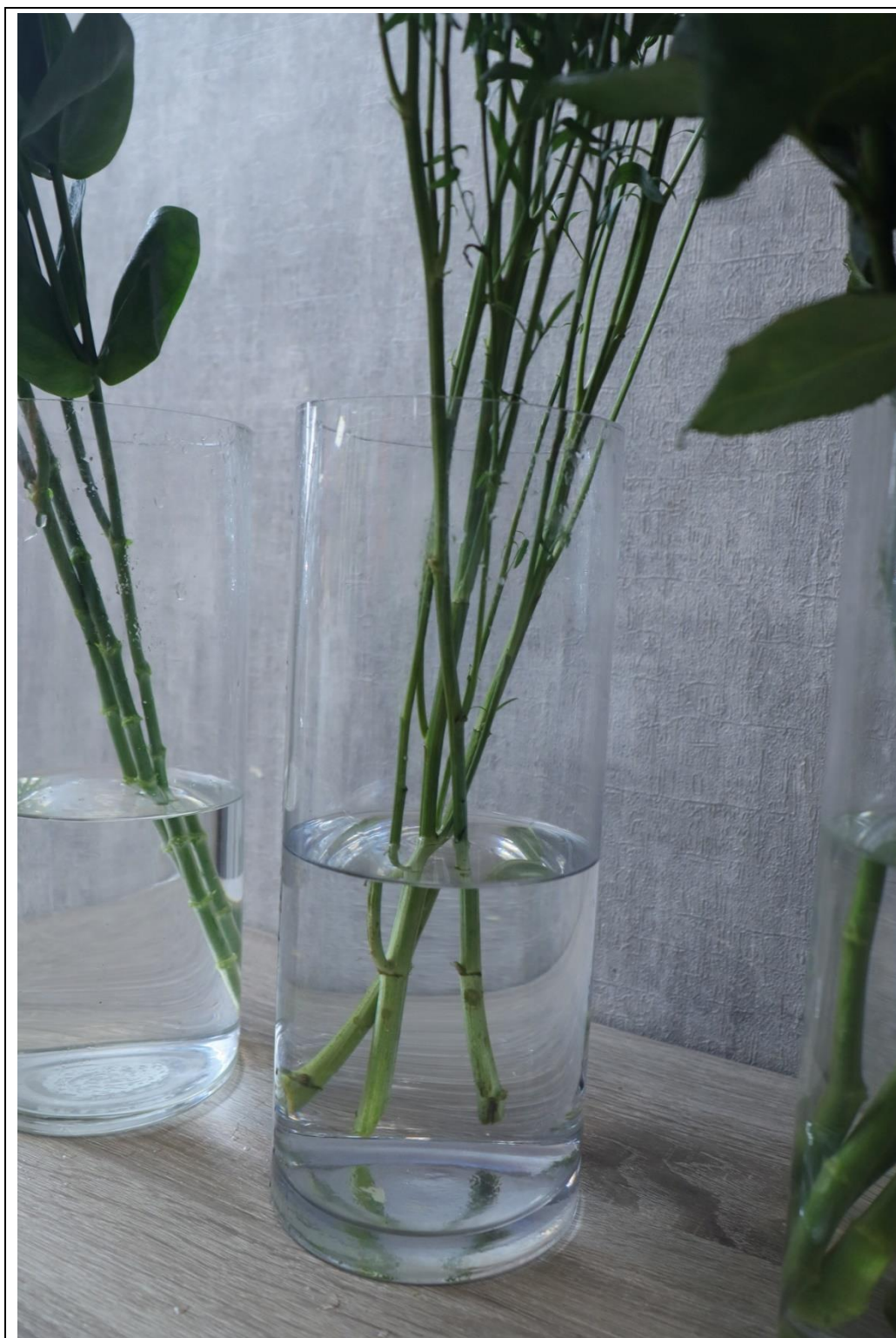
圖 5：紫孔雀整理後細節