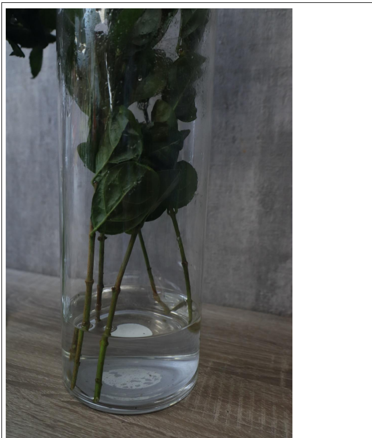
圖 3：茉莉葉整理後細節