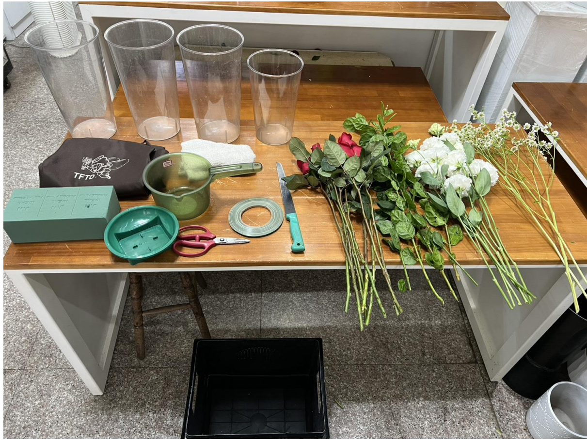
圖 1：術科考試材料範例