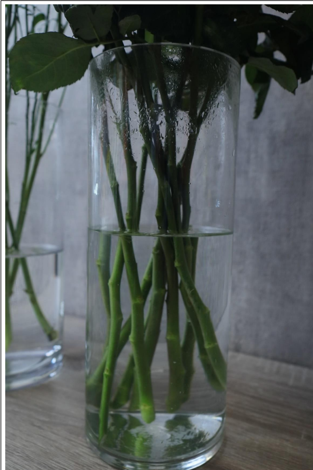
圖 4：玫瑰花整理後細節