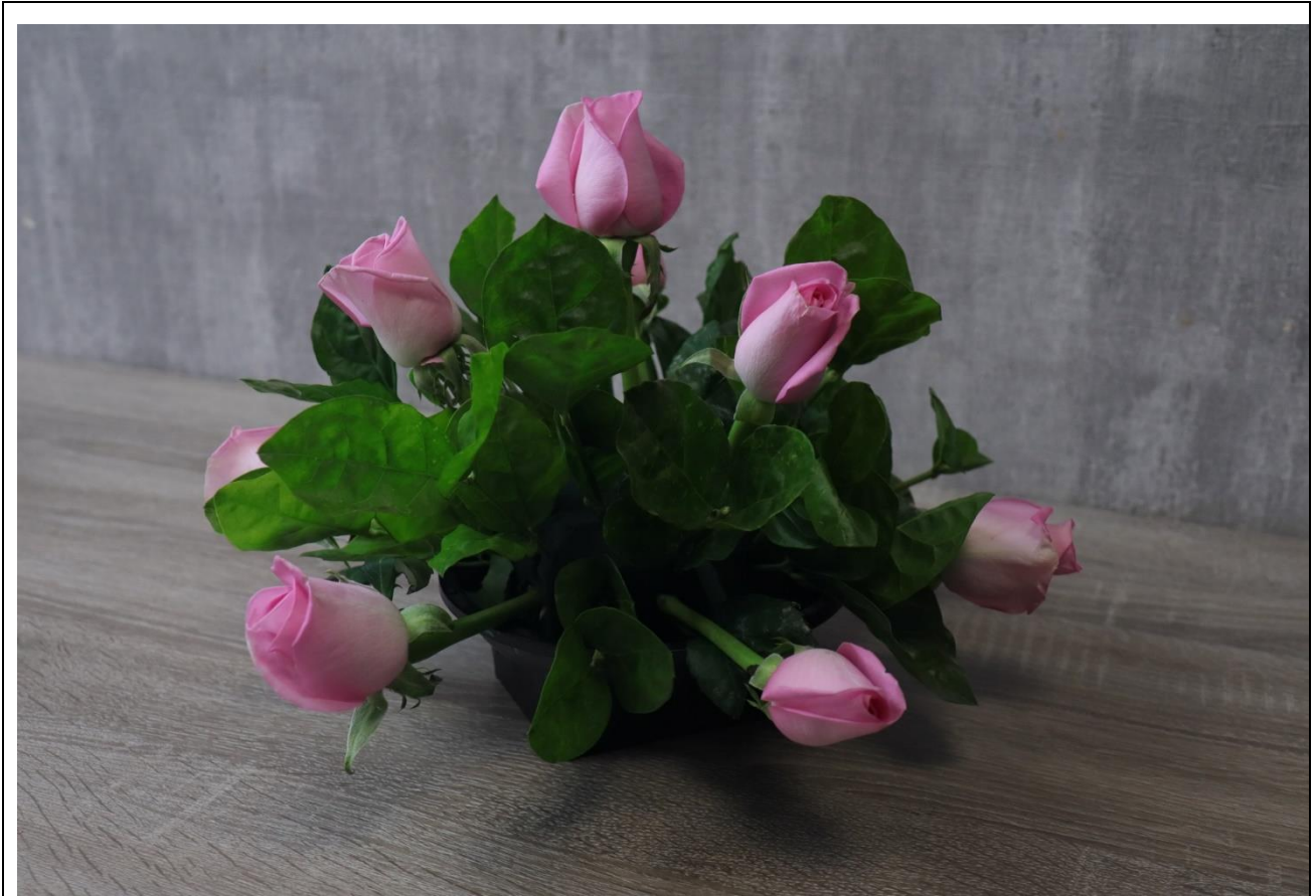
圖 11：參考插作步驟二