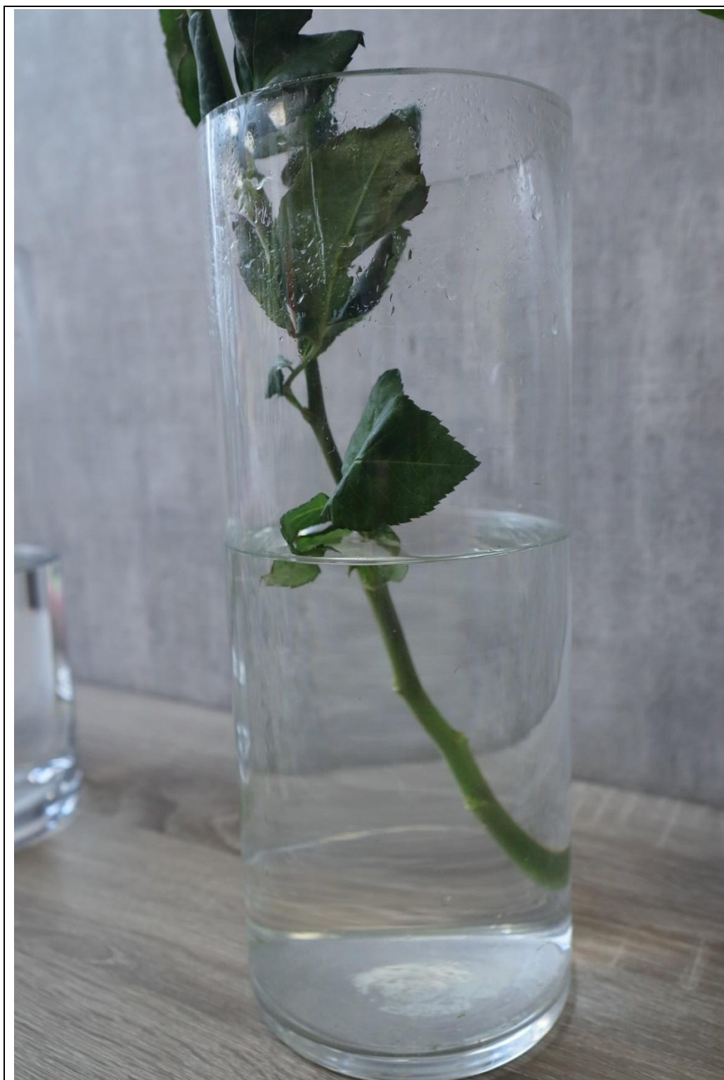
圖 16：扣分範例二，葉片泡水