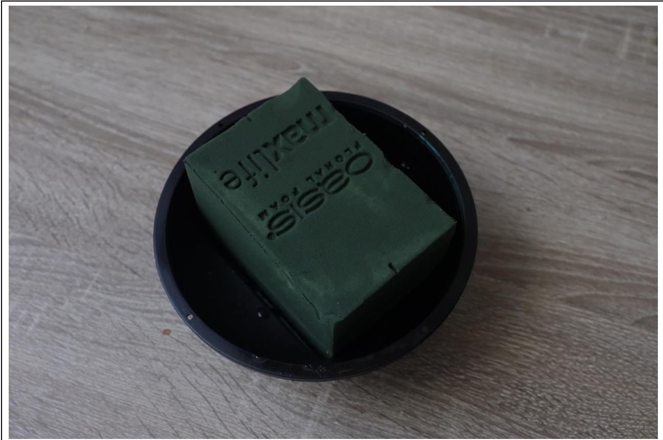
圖 22：扣分範例八，海綿未固定好