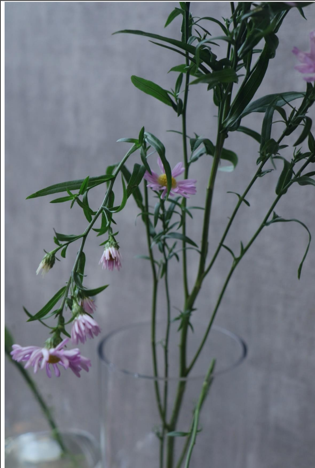
圖 19：扣分範例五，斷枝未修剪