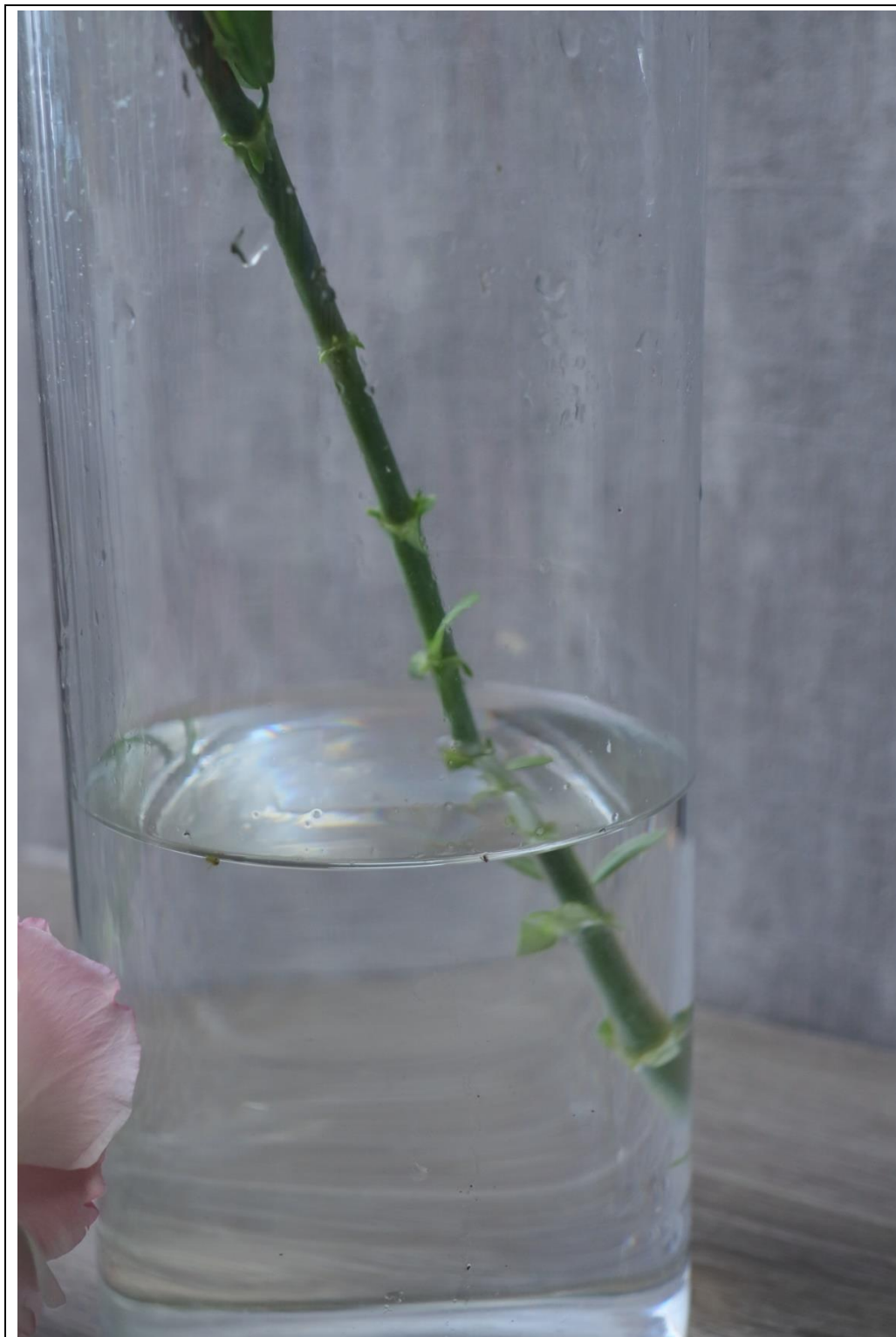
圖 20：扣分範例六，枝條整理不乾淨