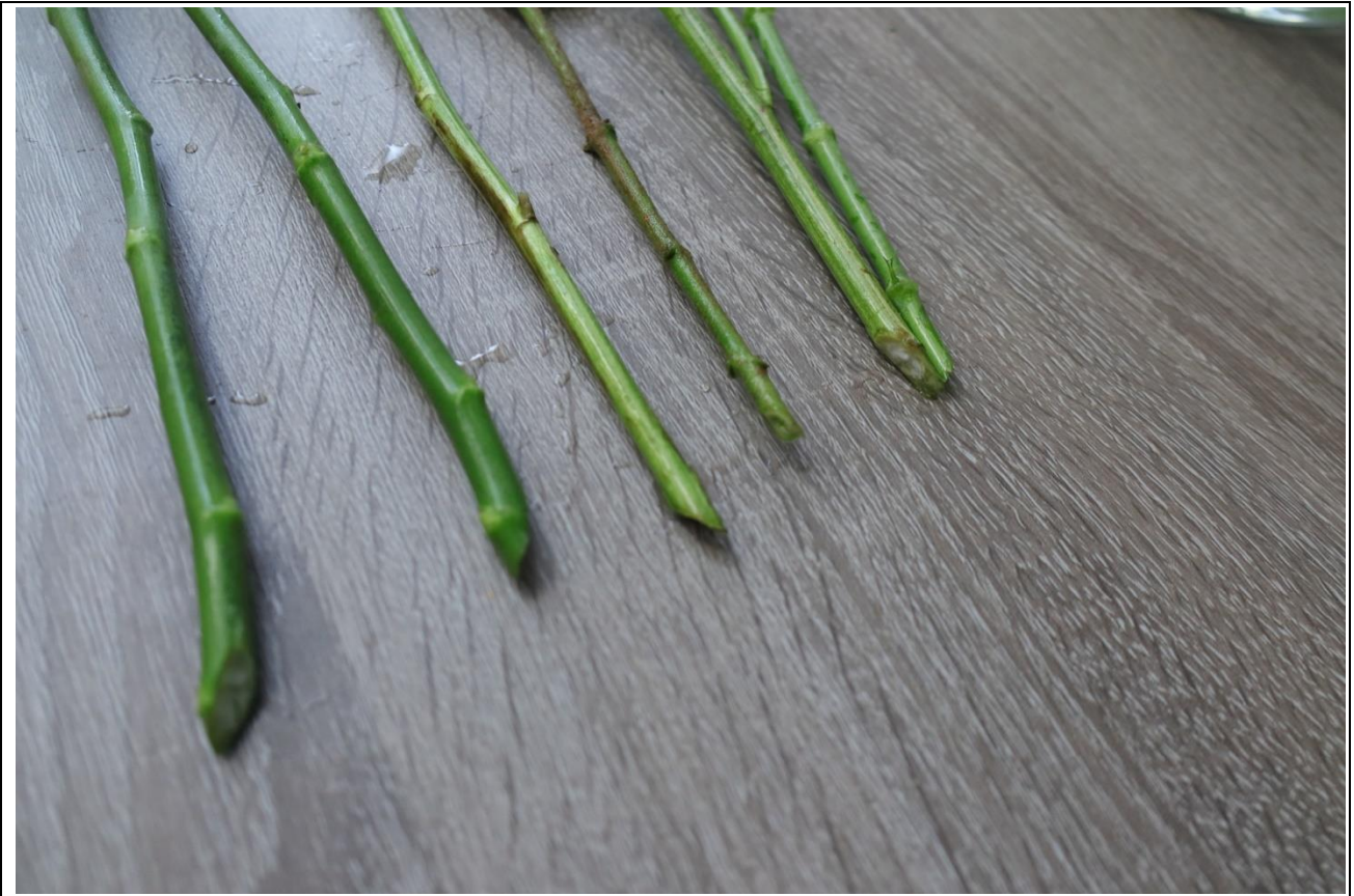
圖 7：花材整理後花腳細節