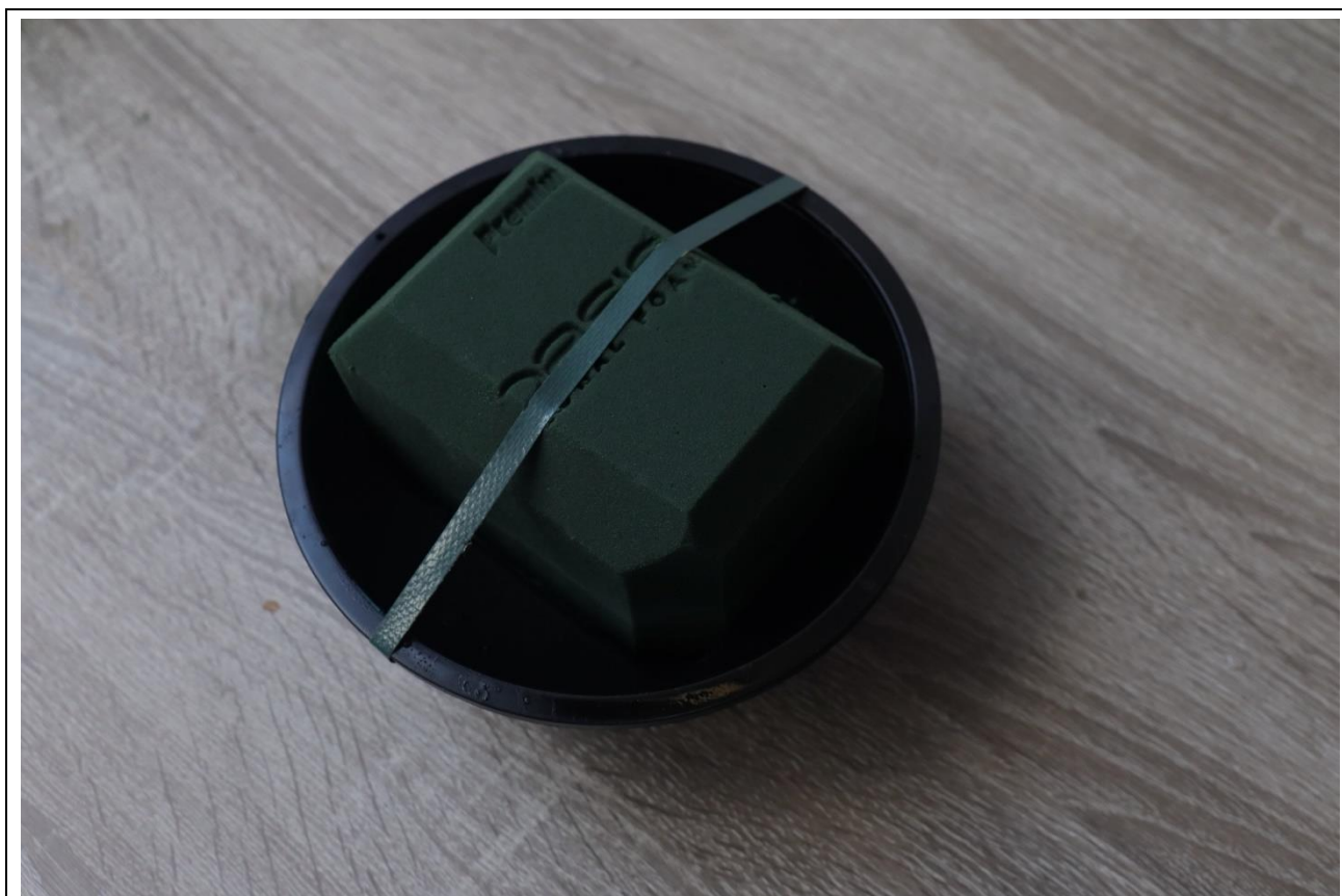
圖 8：海綿切割與固定範例－1