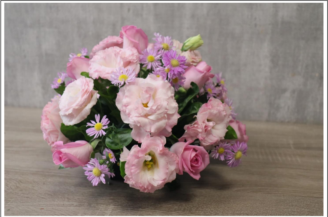
圖 13：參考插作步驟四(完成)