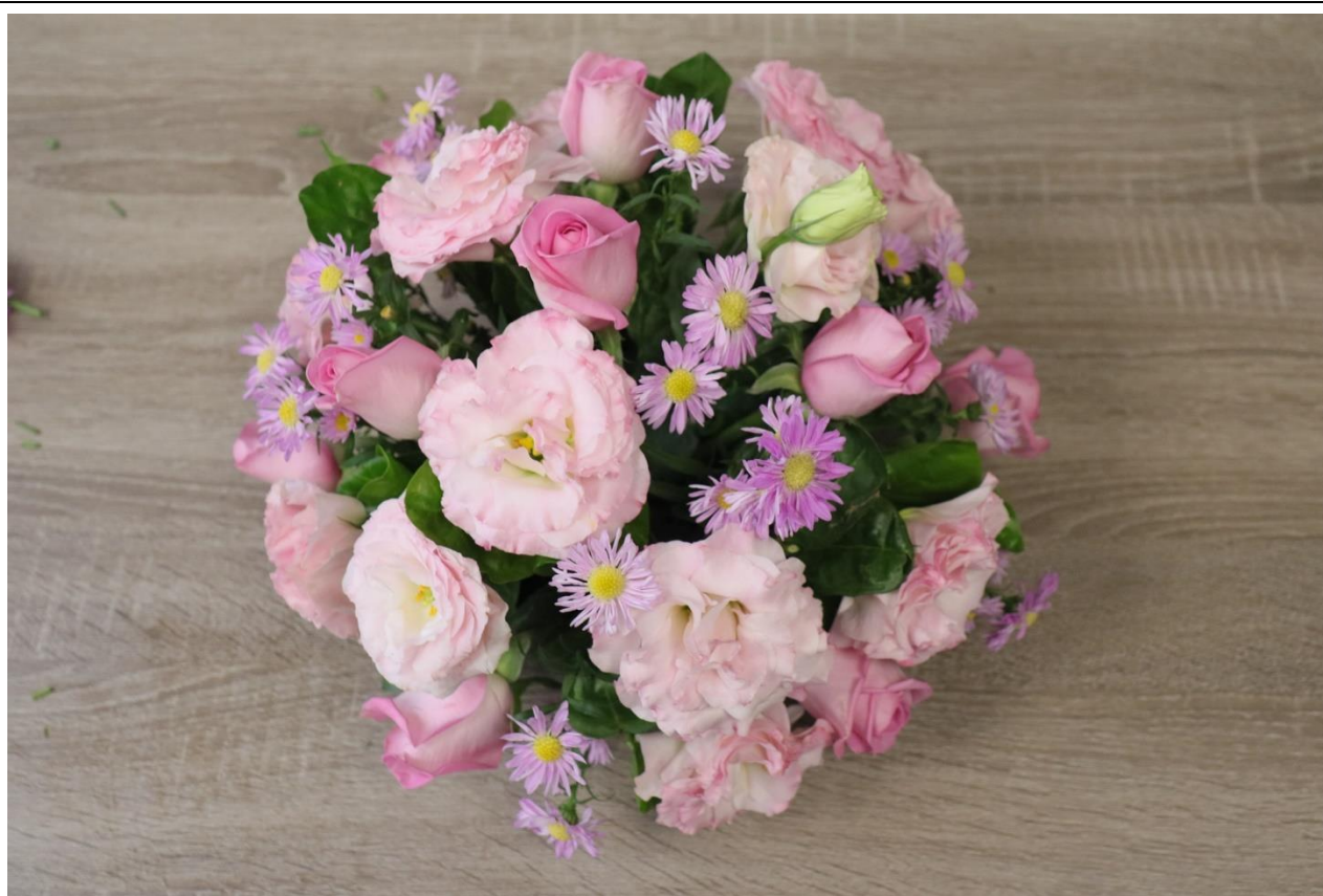
圖 14：完成作品俯視圖