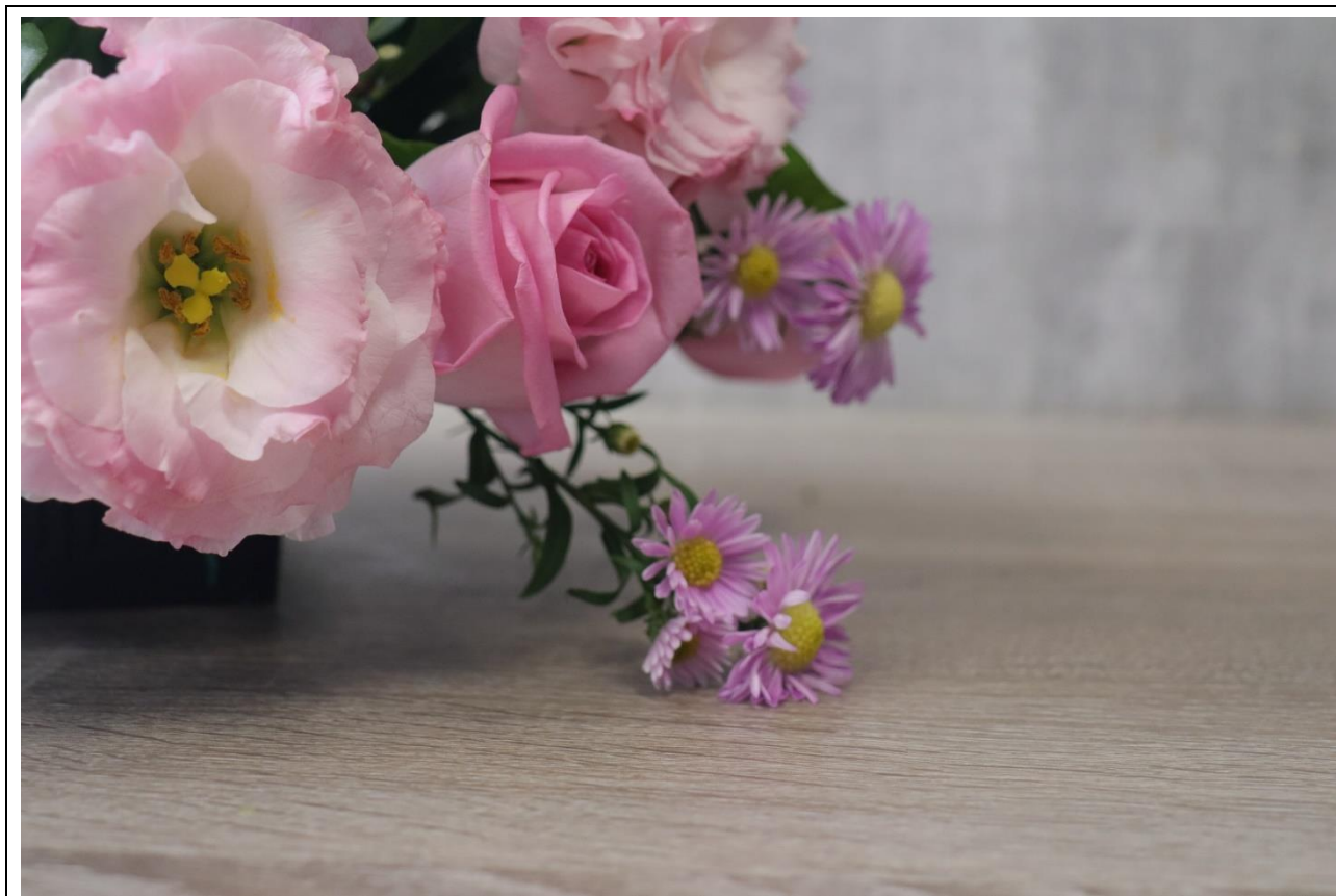
圖 25：扣分範例十一，作品花朵碰到桌面