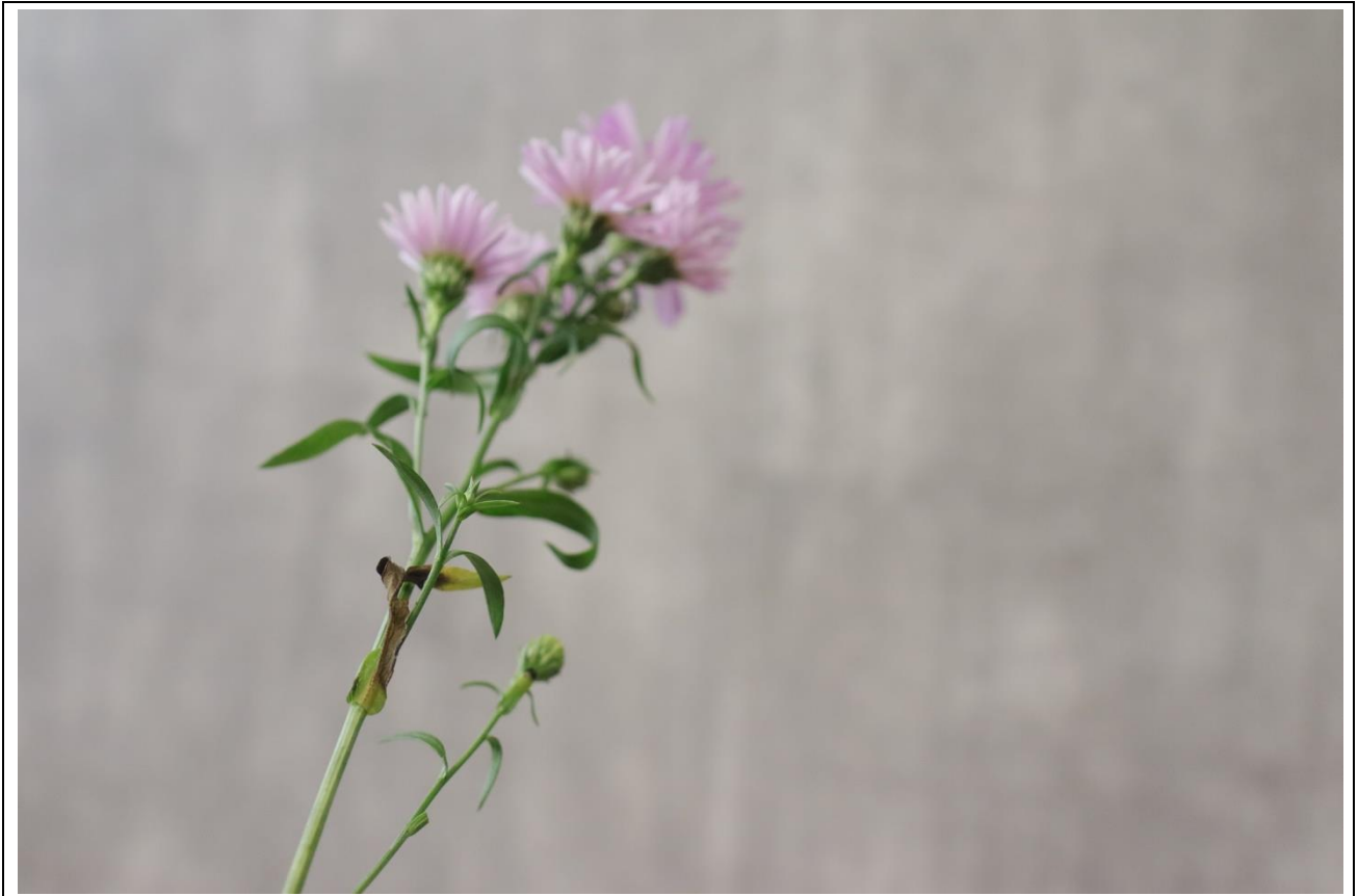
圖 26：扣分範例十二，作品上病葉、破損葉、殘葉未摘除，明顯可見。