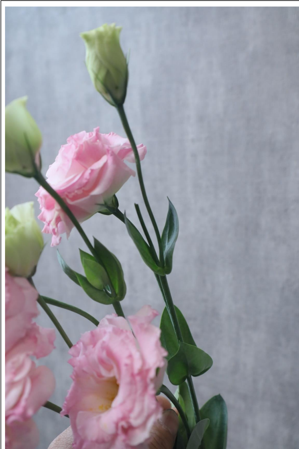
圖 21：扣分範例七，修剪後的殘餘花枝未整理乾淨