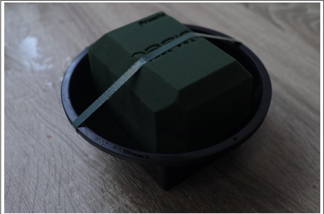
圖 9：海綿切割與固定範例－2