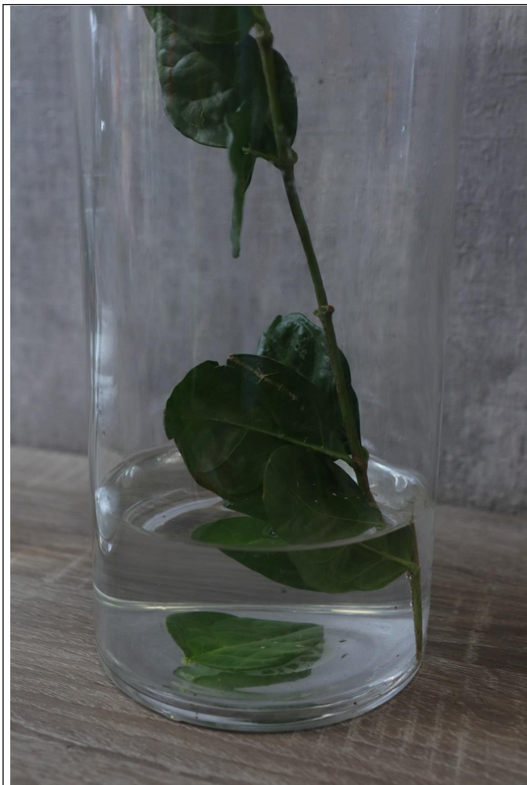
圖 15：扣分範例一，水中有落葉、葉片泡水